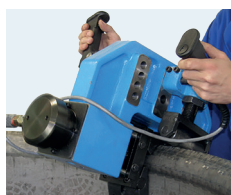
MKF 130/16 · MKF 140/32