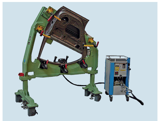
Hydraulikaggregat mit Falzzange / hydraulic drive unit with seamclosing pliers