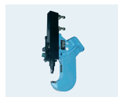
Stanzbügel / punching unit