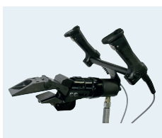
MZ 20 · MZ 30