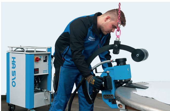
Hydraulikaggregat mit mobilem Kraftformer zum Bördeln. / Hydraulic drive unit with portable Kraftformer for flanging.