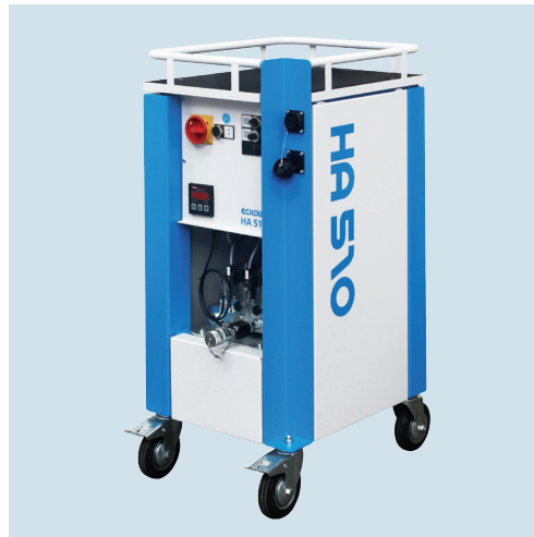
HA 510 Flexibel mit umfangreicher Modellpalette Flexible with an extensive range of types