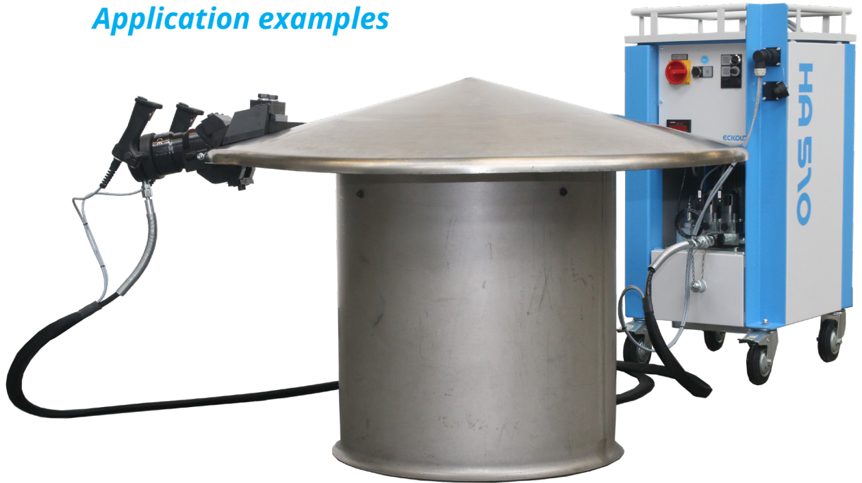
Hydraulikaggregat mit mobiler Zange zum Bördeln. / Hydraulic drive unit with portable pliers for flanging.