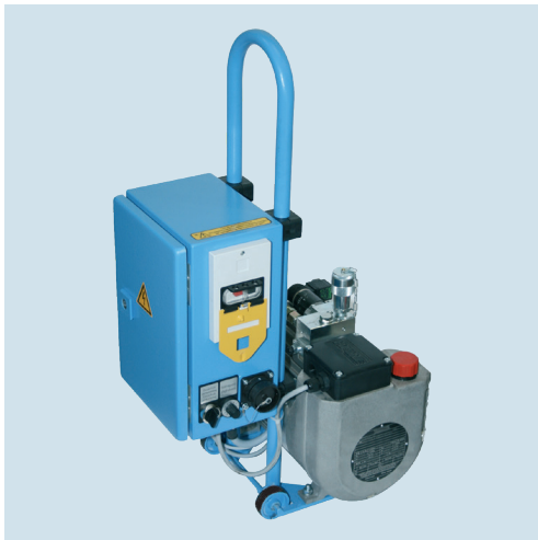
HAT 525 Die mobile Lösung / The portable solution

Depending on planned applications, hydraulic drive units in special and also stationary design can be added to our range of standard hydraulic drive units, which are field-proven in the best way.