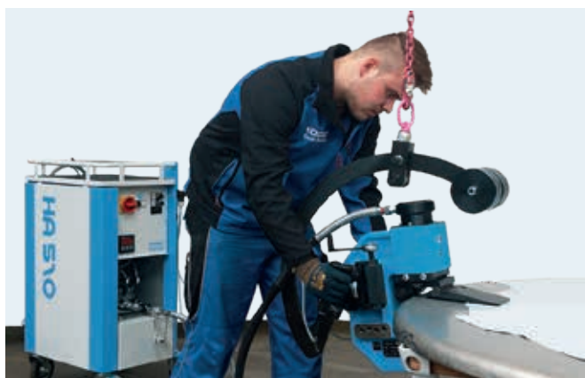
Hydraulikaggregat mit mobilem Kraftformer zum Bördeln. / Hydraulic drive unit with portable Kraftformer for flanging.