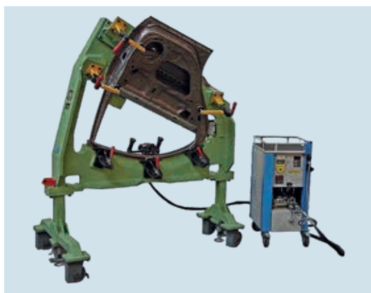
Hydraulikaggregat mit Falzzange / hydraulic drive unit with seamclosing pliers