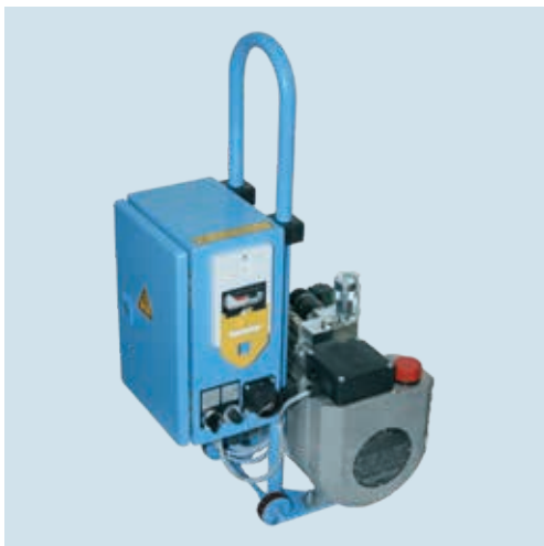
HAT 525 Die mobile Lösung / The portable solution

Depending on planned applications, hydraulic drive units in special and also stationary design can be added to our range of standard hydraulic drive units, which are field-proven in the best way.