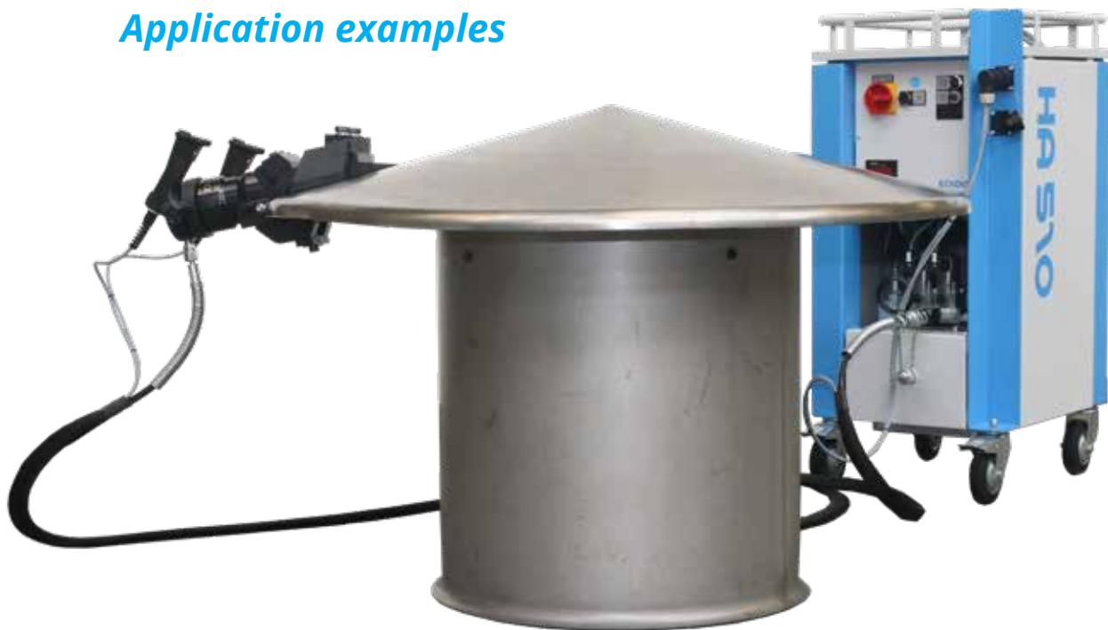
Hydraulikaggregat mit mobiler Zange zum Bördeln. / Hydraulic drive unit with portable pliers for flanging.