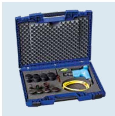
GL 2 MAX KIT 3 Alles in einem Koffer. Everything in one box.