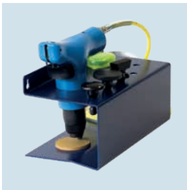
GL 2 KIT 1 Einsätze zum Glätten, Treiben und Schweifen. Inserts for planishing, stretching and curving.