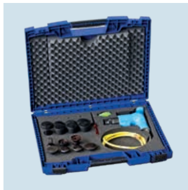
GL 2 MAX KIT 3 Alles in einem Koffer. Everything in one box.